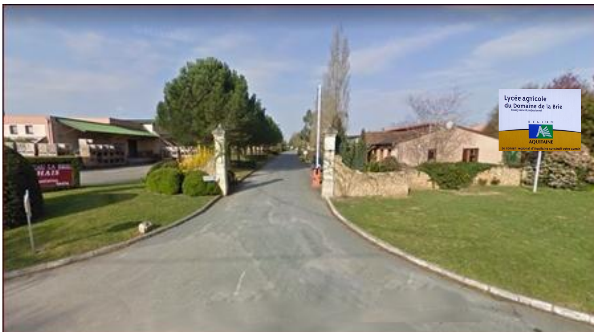
L'entrée du Lycée Agricole du Domaine de la Brie en bordure de la RD n° 13 Bergerac Monbazillac