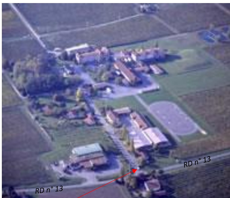
Entrée du domaine de la Brie

Pour préserver l'environnement, n'oubliez pas de vous regrouper pour voyager