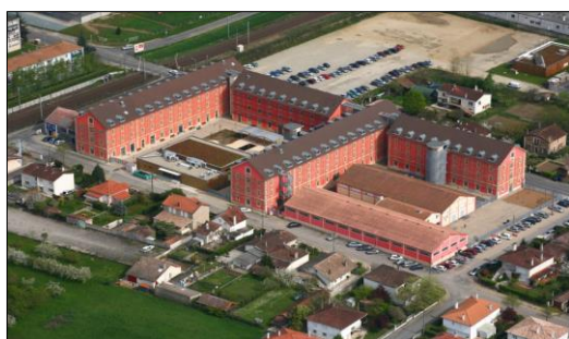
Vue aérienne de la Cité de la formation et son parking

Pour préserver l'environnement, n'oubliez pas de vous regrouper pour voyager