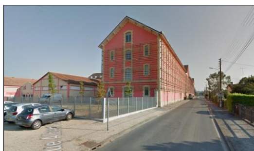
Rue Albert Camus à Marmande

Si par inadvertance il vous arrivait de modifier le Framacalc voici sa présentation d'origine